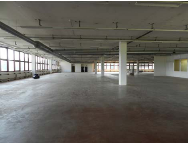
Fläche 2. Obergeschoss