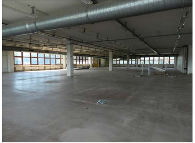
Fläche 2. Obergeschoss