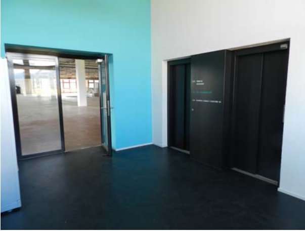
Zugang Mietfläche/Treppenhaus 2. Obergeschoss