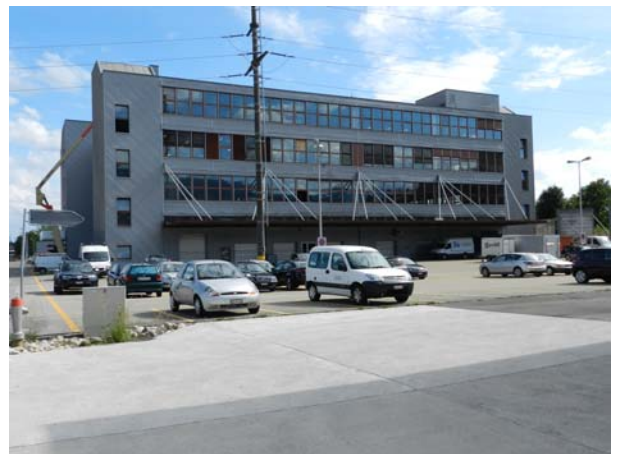
Aussenansicht Nordseite inkl. Parkplatz